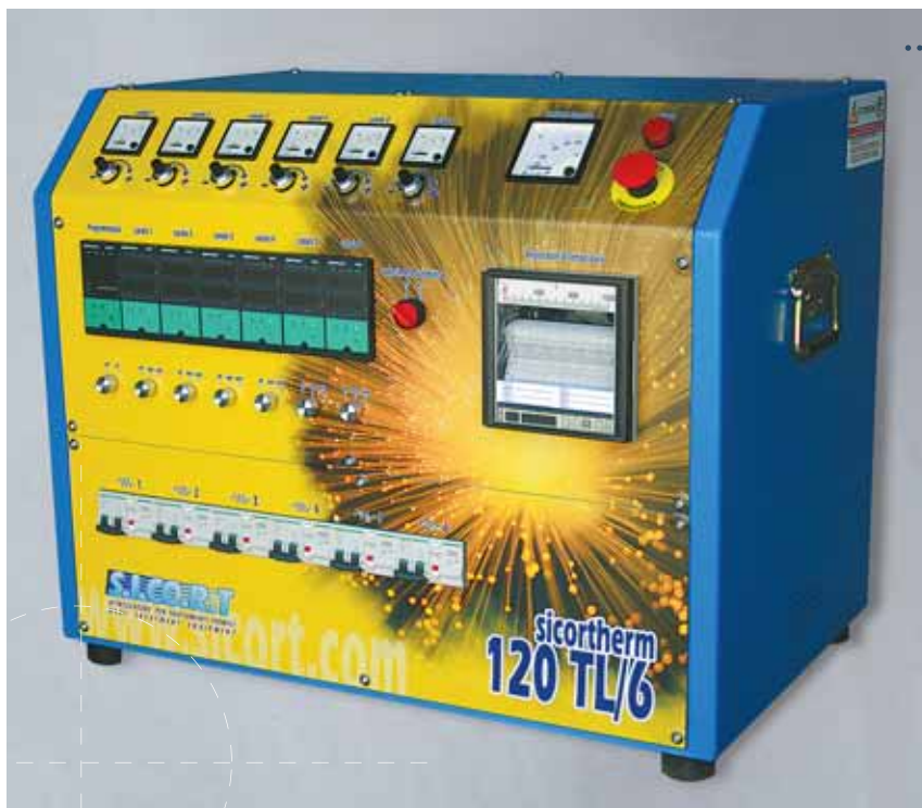
Maquinas para resistencias mod. TL